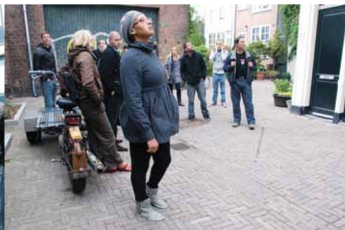
De laatste flat, een aan de Nieuwe Jonkerstraat, dient als woonruimte voor studenten die een studie volgen die alleen in Amsterdam wordt aangeboden.