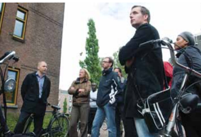
Bij MyPlace wordt kort iets uitgelegd over het complex. 'Studenten betalen ongeveer 350 euro inclusief voor een eigen kamer en een gedeelde badkamer en keuken.'