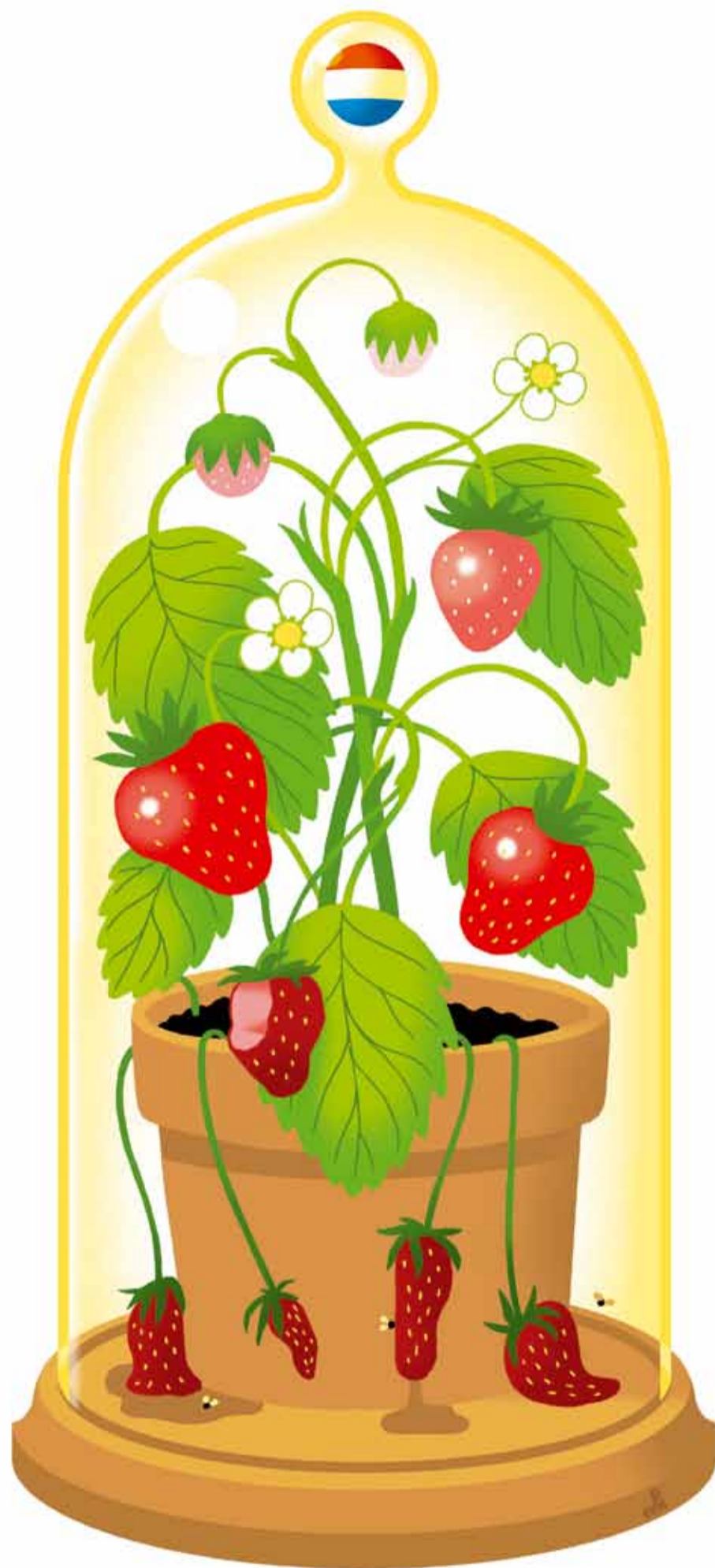
illustratie Marc Kollé

Tesseltje de Lange is universitair docent bestuurs- en migratierecht.