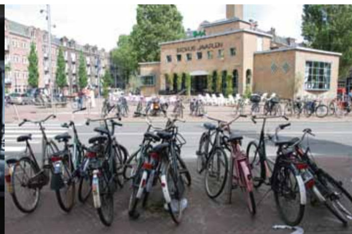
De fietsen op het Javaplein staan keurig gestald voor MyPlace en vallen niet eens meer op in het walhalla van fietsen dat Amsterdam-Oost heet.