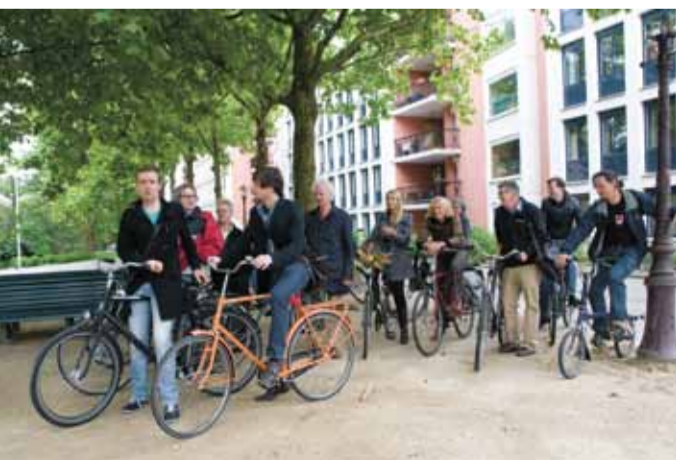
De groep komt aan bij het studentencomplex aan het Bijltespad. Even staan ze op een groenstrook voor de flat bij te komen van de lange fietstocht.