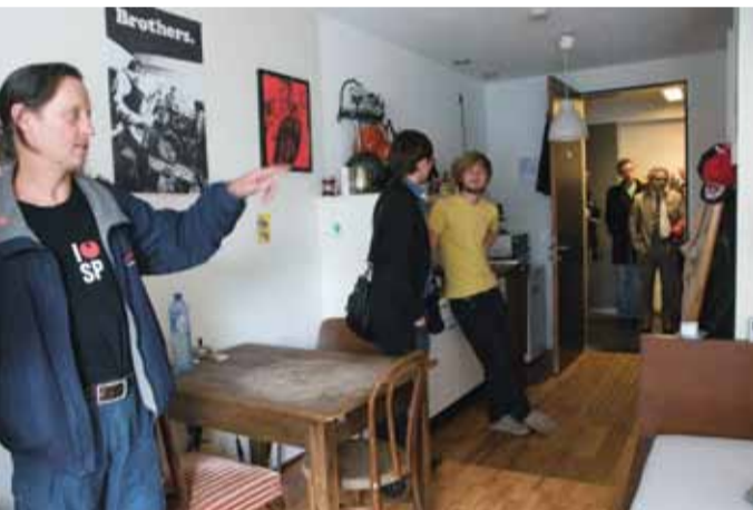
Een van de studentenkamers van het complex op het Science Park wordt opengesteld voor de groep. Aarzelend blijven velen in de deuropening staan.