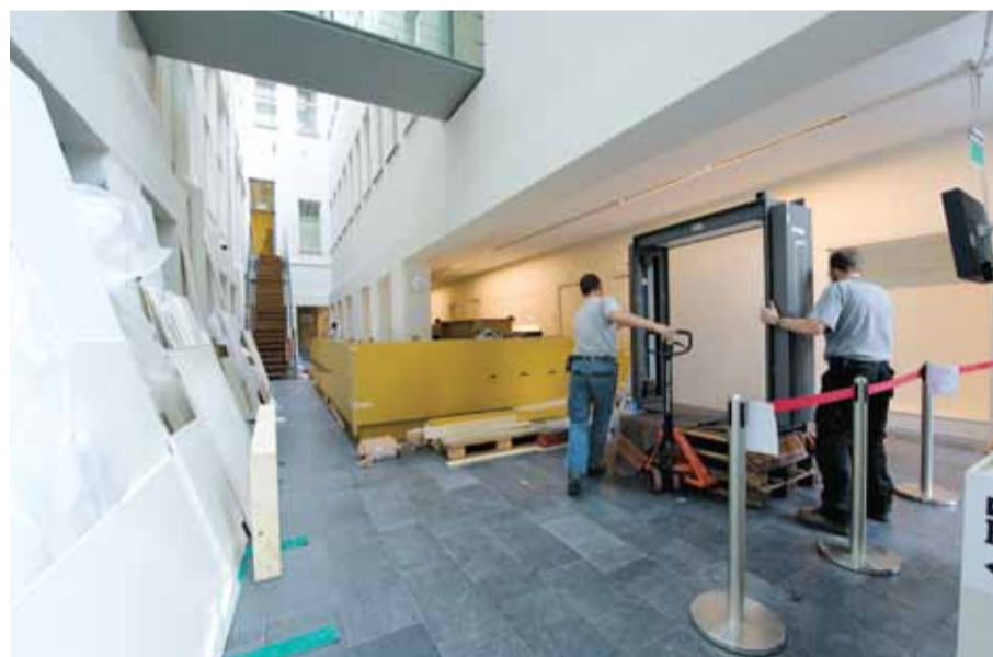
De bouw van de boekwinkel in Bijzondere Collecties

'Met een subsidie van 125.000 euro van de UvA Holding konden we het klantenbestand, de naam en faam en de voorraad van Nijhof & Lee overnemen,' zegt hoofdconservator Garrelt Verhoeven van de Bijzondere Collecties. 'Een deel van dat bedrag is overigens een lening die we moeten terugbetalen uit de verkopen in de winkel.' In de nieuwe boekwinkel zal niet alleen de collectie van de voormalige