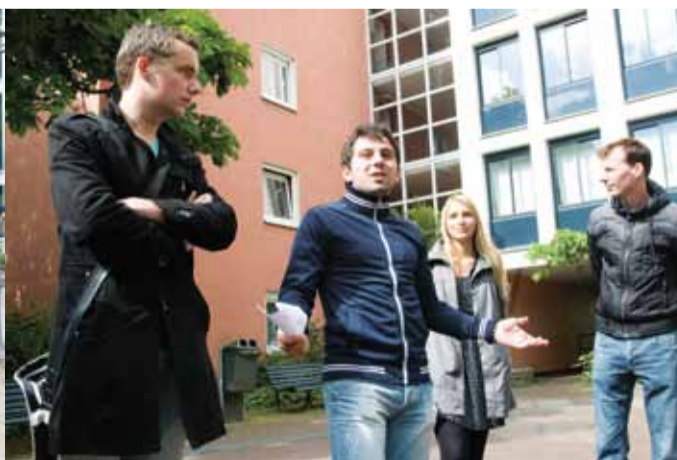
Een internationale student vertelt over het wonen aan het Bijltespad. 'Alle internationale studenten worden hier bij elkaar gezet. Best fijn, want die Nederlanders praten niet echt.'